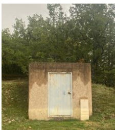
Réservoir des Agreniers